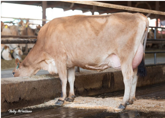
JX PROGENESIS MINNIE {5} GRANDDAM